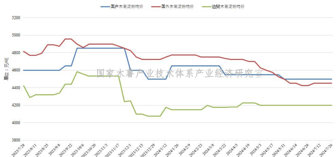
图3 2023年7月份以来中国各类木薯淀粉均价变化情况