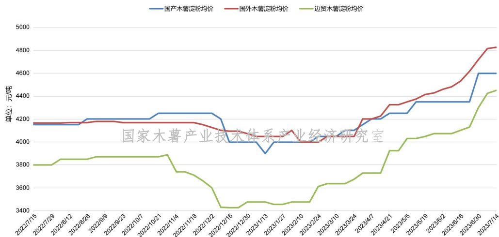
图3 2022年7月份以来中国各类木薯淀粉均价变化情况