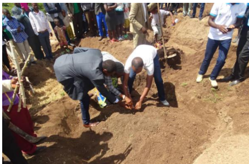
图 1 木薯插条种植新技术示范