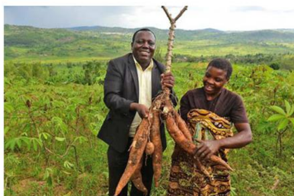
采用传统播种方法的收获情况