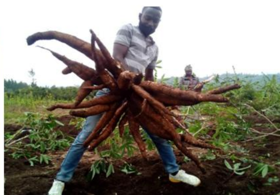
采用新播种技术的收获情况