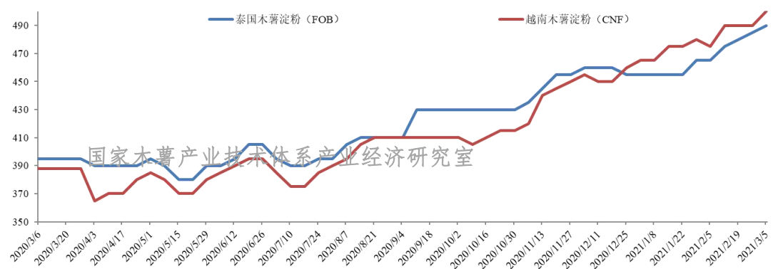
图4 2020年3月份以来泰国、越南木薯淀粉外盘价格变化情况 单位：美元/t